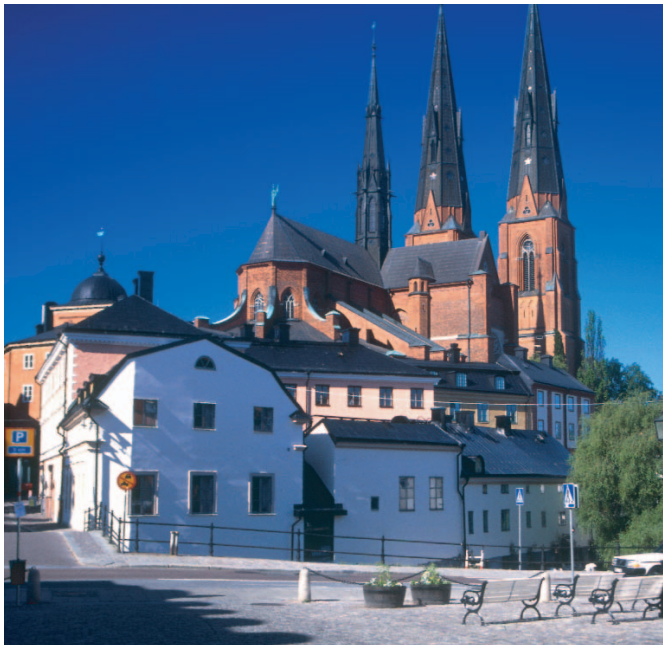
Rycharð Ryan / www.imagebank.sweden.se